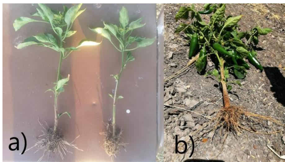
Figura 2. a) Planta de chile inoculada Derecha; b) Raíz sana de chile jalapeño inoculada con microbiológicos benéficos.